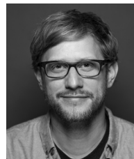
Alexander Zuckowski Komponist