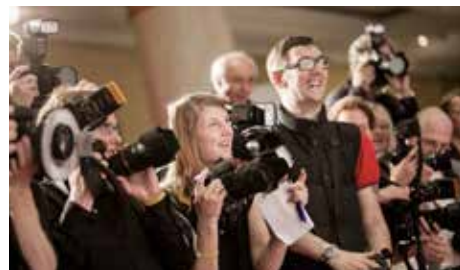
„Guck doch mal zu mir!“ Die Fotografen belagerten die rund 300 Gäste aus Kultur, Politik und Wirtschaft.