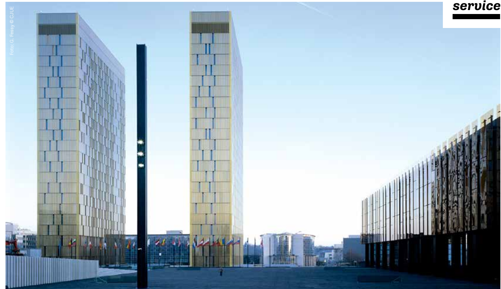
Gerichtshof der Europäischen Union in Luxemburg

Für die GEMA und ihre europäischen Schwestergesellschaften ist das Urteil ein wichtiger Erfolg. Der Vorwurf einer angeblichen wettbewerbswidrigen Verhaltensabstimmung im Rahmen früherer Gegenseitigkeitsverträge wird vom Gericht in aller Deutlichkeit zurückgewiesen. Das Urteil verdeutlicht erneut die dringend notwendige Schaffung eines verlässlichen EU-Rechtsrahmens für die grenzüberschreitenden Aktivitäten von Verwertungsgesellschaften.