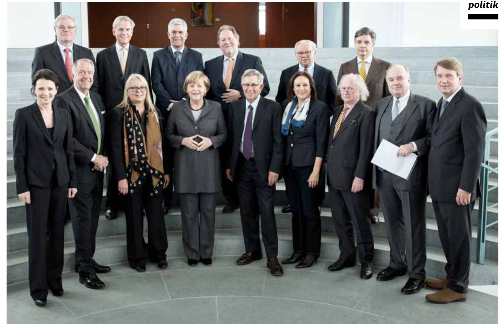
Beim Treffen der Deutschen Spitzenvertreter aus der Kreativwirtschaft mit Bundeskanzlerin Angela Merkel vereinbarten beide Seiten einen kontinuierlichen Dialog.

Die soziale und kulturelle Arbeit, die die GEMA leistet und die nicht nur im Deutschen Musikautorenpreis ihren Ausdruck findet, sondern auch in den zahlreichen Projekten, die die GEMA gemeinsam mit der Bundesregierung und der GVL im Rahmen der „Initiative Musik“ fördert, hob der Kulturstaatsminister lobend hervor. Die hervorragende Arbeit in diesem Bereich im Laufe der vergangenen Jahre hat dazu geführt, dass der Deutsche Bundestag 1 Million Euro zusätzlich bereitgestellt hat. Diese Mittel sollen nun in die Stiftung eines Spielstätten-Programmpreises fließen, mit dem die Arbeit der kleinen und mittleren Pop-, Rock- und Jazz-Bühnen Deutschlands gewürdigt werden soll. „Mit ihrer Arbeit und Risikobereitschaft tragen diese wesentlich dazu bei, dass Musiker und Autoren sich entwickeln können“, erklärte Neumann. Somit leistet die GEMA auch einen wichtigen Beitrag zur Förderung des eigenen Nachwuchses.